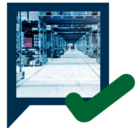
LANGSTRECKENTRANSPORT VON PALETTEN